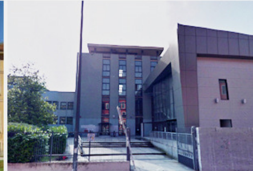
Liceo G. Carducci